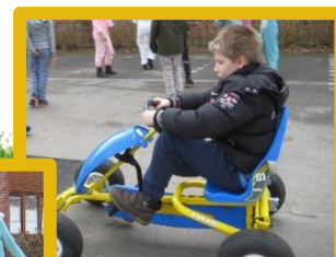
De wieltjesdagen blijven een succes!