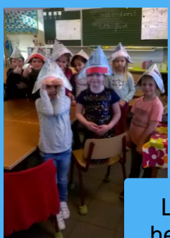
Letterfeest in het 1 ste leerjaar

❺ De voorrangsregeling van inschrijvingen (broer/zus of personeel) zijn voorbij. Vanaf 1 april (en wegens vakantie dus 16 april) kunnen alle andere kinderen inschrijven.