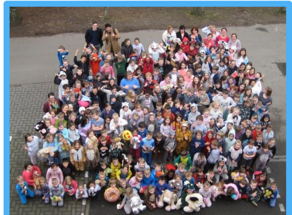
Heel de school in pyjama, voor de Bednet-actie.

https://www.youtube.com/watch?v=IQX5SOn1TEM